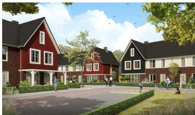
voorbeeld recreatief wonen