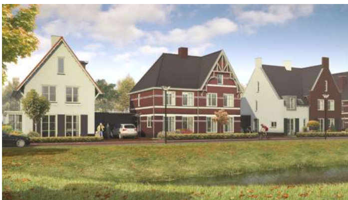
voorbeeld romantisch wonen