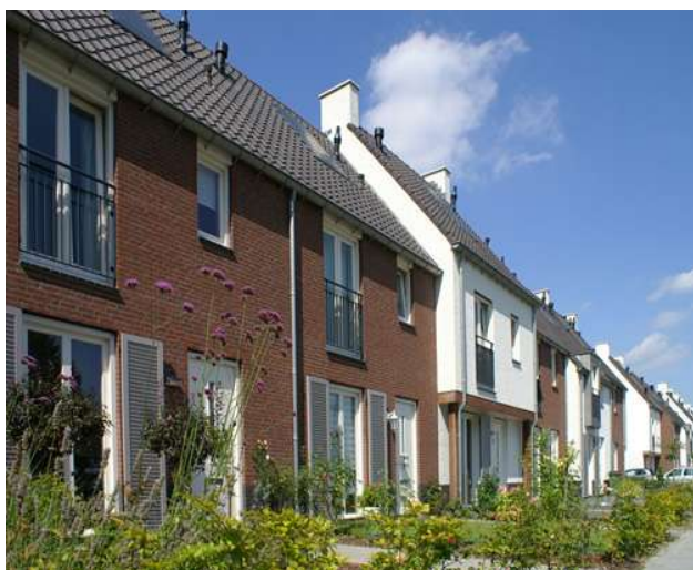
voorbeeld traditionele stijl

Architectenbureau Visser en Bouwman is een middelgroot architectenbureau dat is gevestigd in 's-Hertogenbosch. Wij zijn actief in bijna alle sectoren van de bouw. Wij realiseren gemiddeld ongeveer 400 woningen per jaar (2012). Wij hebben ervaring met diverse bouwconcepten zoals o.a. : PCS, Huismerk, Wenswonen, Optio, IQ, Groothuis e.a. Daarnaast helpen wij bouwers met de ontwikkeling van hun eigen conceptwoning met het VB-referentieplan.